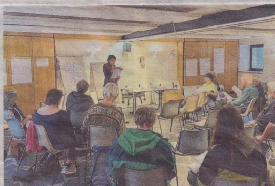
L'activité de l'association pour 2026 est d'ores et déjà bien engagée.

Le rapport d'activité a rappelé les trois activités principales proposées en 2025 par Trièves transitions écologie. Le groupe de travail agriculture s'est par exemple particulièrement investi sur le sujet de la transmission des fermes en Trièves : l'occasion de souligner que « contrairement à la tendance au niveau national, l'emploi agricole a progressé dans le Trièves à hauteur de +7 % en 10 ans, de même que le bio et les circuits courts ». Le groupe de travail « Du soleil pour cuisiner » a quant à lui organisé sur l'année trois sessions de trois jours du stage « Je construis mon four solaire », qui a rassemblé au total 24 participants venus de la France entière. Enfin, le volet « Lutte contre la précarité énergétique », qui vise à aider les personnes en précarité énergétique grâce à l'installation gratuite de panneaux photovoltaïques, a concerné l'équipement de 7 habitations en 2025 ainsi qu'une installation sur le toit de la ressourcerie l'Étrier à Monestier-de-Clermont. Par ailleurs, l'association a été re-